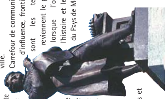
G. Cuvier par David d'Angers - 1835

le vert lumineux des paysages forestiers ou agricoles entourant la ville. Carrefour de communication, zone d'influence, frontières, portes, sont les termes qui reviennent le plus souvent lorsque l'on évoque l'histoire et le patrimoine du Pays de Montbéliard.