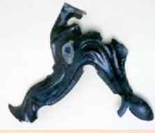
Fragment de pavillon de carnyn I er siècle av.J.C.

Zone de passage oblique entre les régions occidentales et méridionales et l'espace rhénan, la région de Montbéliard a de tout temps fixé les populations, qui ont su profiter de ses attraits et de ses ressources naturelles. Les collections archéologiques du musée proviennent principalement de sites régionaux.