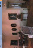
Salons de l'Hôtel Beurnier-Rossel

LE MUSÉE DU CHÂTEAU DES DUCS DE WURTEMBERG cour du Château 25200 Montbéliard