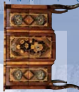
Commode marquetée Abraham Nicolas Couleru fin XVIII siècle