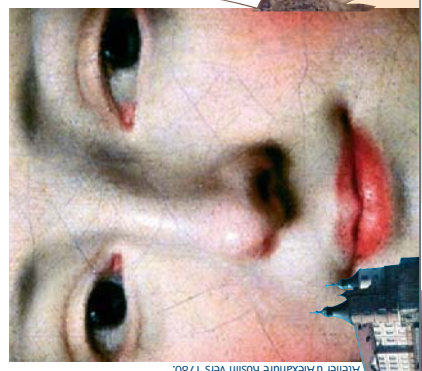
Portrait de Marie-Féodorovna (détail) Artiste d'Alexandre Roslin vers 1780.